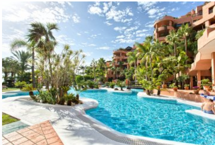
Новая Золотая Миля, Эстепона